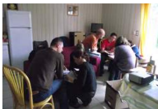
Week-end de travail CA